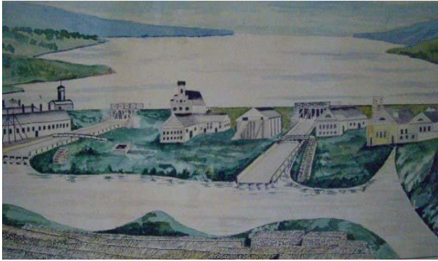
Лысьвенский завод, конец 19 века. (городской музей)

покоса, скота, птицы, иногда даже пашни.