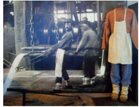
Прокатчики. Конец XIX века

покоса, скота, птицы, иногда даже пашни.